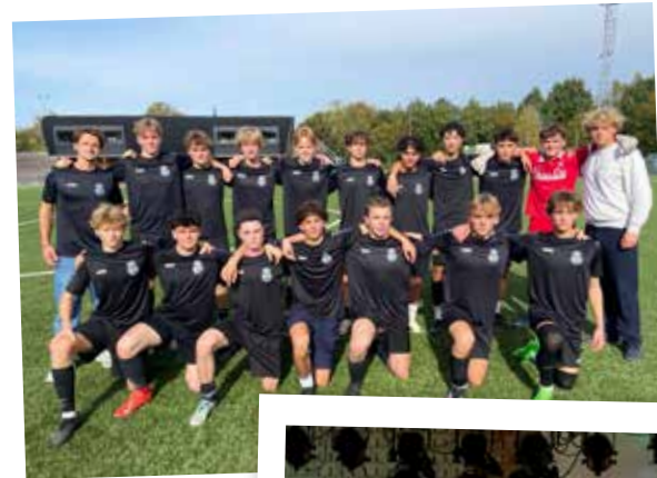
ONZE VOETBAL- PLOEG